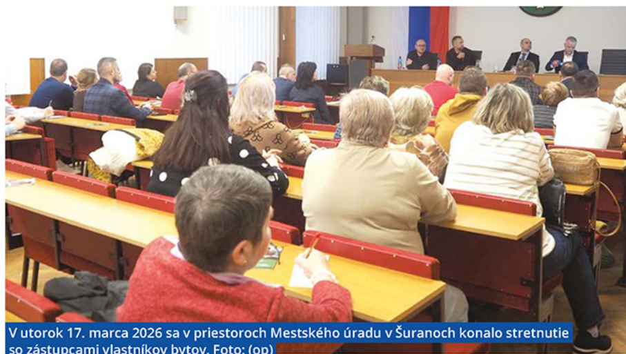
V utorok 17. marca 2026 sa v priestoroch Mestského úradu v Šuranoch konalo stretnutie so zástupcami vlastníkov bytov.

Modernizácia systému CZT v Šuranoch má odstrániť už spomínaný, desiatky rokov starý investičný dlh a pripraviť tepelné hospodárstvo na ďalšie desaťročia bezproblémovej výroby a dodávky tepla do šurianskych domácností. Projekt v celkovej hodnote 8,36 milióna eur v úzkej spolupráci s vedením mesta pripravoval MBP Šurany od roku 2024.