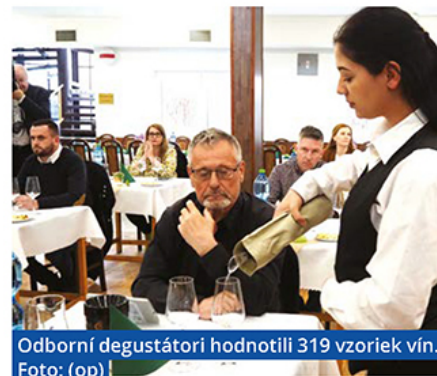
Odborní degustátori hodnotili 319 vzoriek vín.