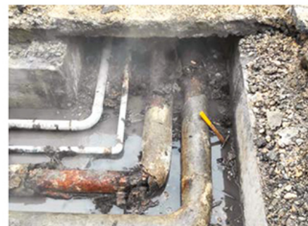
Oprava havarijného stavu rozvodov realizovaná v januári 2026 na Mudrochovej ulici.