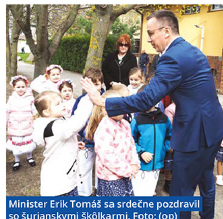
Minister Erik Tomáš sa srdečne pozdravil so šurianskymi škôlkarmi.

Pred odchodom minister krátko podebatoval s prítomnými občanmi a so Šuranmi sa rozlúčil vetou: „Keď sa deti smejú, je šťastný svet.“ Možno prednedávnom by bola vnímaná ako kliše, dnes sa však ukazuje jej hlboká pravda. (op)