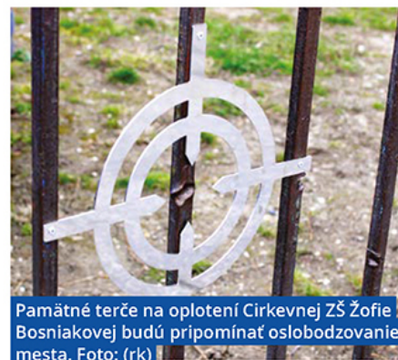
Pamätné terče na oplotení Cirkevnej ZŠ Žofie Bosniakovej budú pripomínať oslobodzovanie mesta.