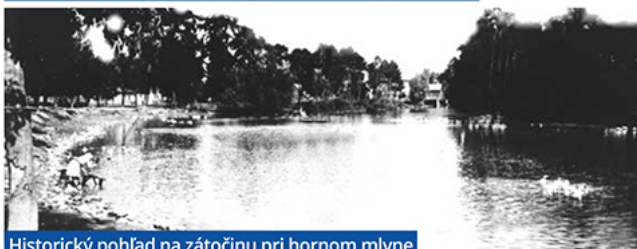
Historický pohľad na zátočinu pri hornom mlyne