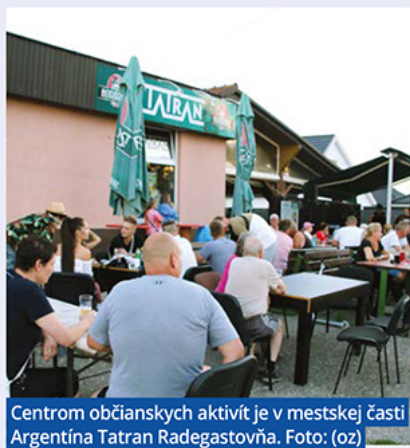
Centrom občianskych aktivít je v mestskej časti Argentína Tatrane Radegastovňa.