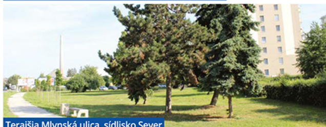
Terajšia Mlynská ulica, sídlisko Sever