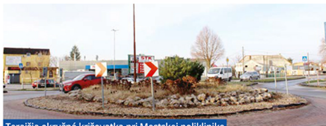
Terajšia okružná križovatka pri Mestskej poliklinike