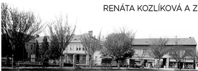
Historický pohľad na Námestie hrdinov

RENÁTA KOZLÍKOVÁ A Z ARCHÍVU DEŽA NÉMETHA