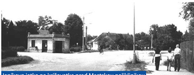
Janíkova jatka na križovatke pred Mestskou poliklinikou