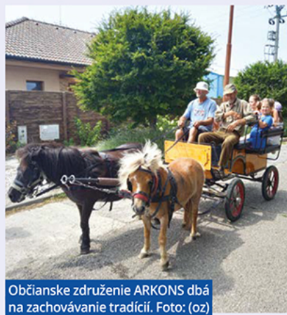
Občianske združenie ARKONS dbá na zachovávanie tradícií.