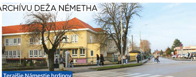
Terajšie Námestie hrdinov