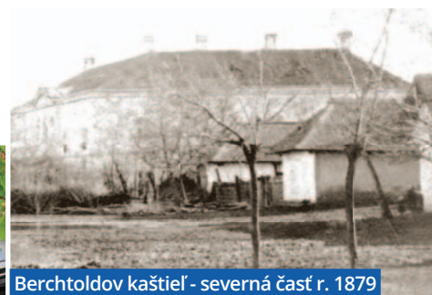
Berchtoldov kaštieľ - severná časť r. 1879

RENÁTA KOZLÍKOVÁ A Z ARCHÍVU DEŽA NÉMETHA