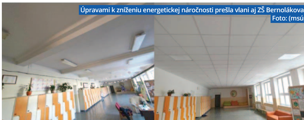
Úpravami k zníženiu energetickej náročnosti prešla vlni aj ZŠ Bernolákova.