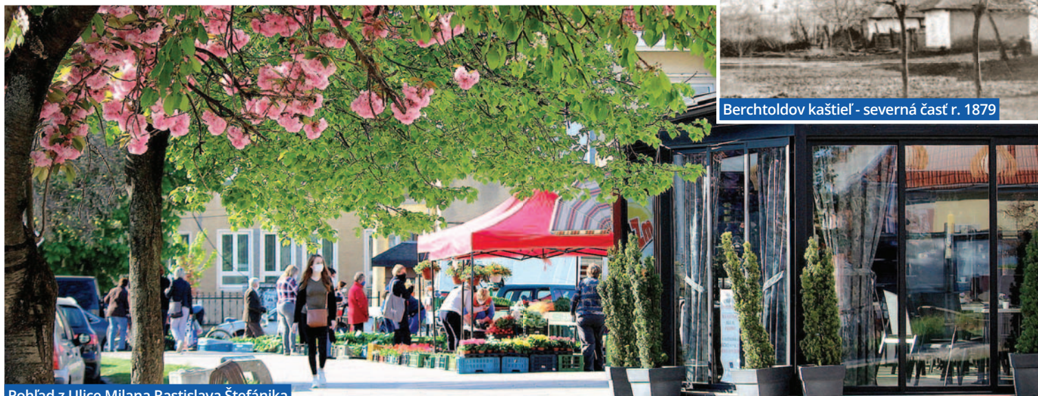
Pohľad z Ulice Milana Rastislava Štefánika