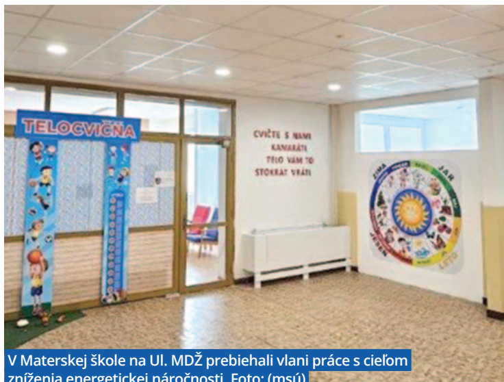
V Materskej škole na Ul. MDŽ prebiehali vlni práce s cieľom zníženia energetickej náročnosti.

P rvým uceleným rokom na bilancovanie výsledkov práce mestskej samosprávy zvolenej v komunálnych voľbách 29. októbra 2022 bol uplynulý rok. Čo priniesol mestu a jeho obyvateľom? Na prahu nového roka prinášame odpočet aktivít súvisiacich s plnením poslania a rozhodujúcich zámerov šurianskej mestskej samosprávy v roku 2023.