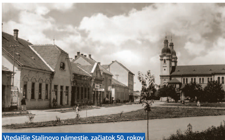
Vtedajšie Stalinovo námestie, začiatok 50. rokov