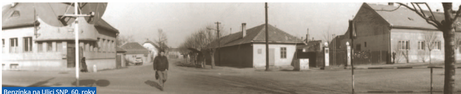
Benzínka na Ulici SNP, 60. roky