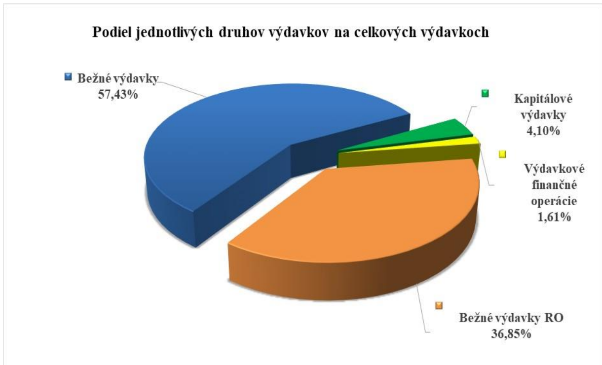
Graf č. 3: Podiel jednotlivých druhov výdavkov na celkových výdavkoch