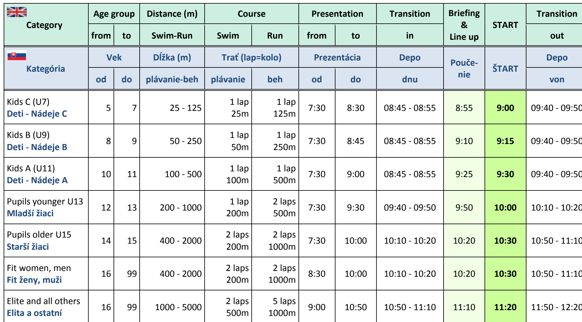
Table of most important information about race, distances and timetables for all categories – date 21 th July 2019 Sunday:

Tabuľka najdôležitejších informácií o pretekoch, vzdialenostiach a časovom harmonograme pre jednotlivé kategórie – dátum 21.júla 2019 nedeľa: