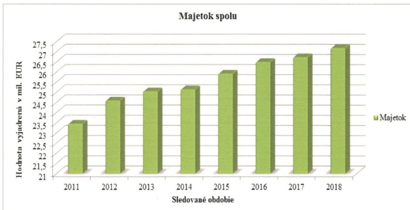
Obrázok č. 1